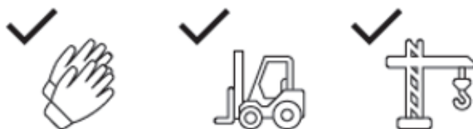
Рис.1 – Схематичне зображення завантаження/розвантаження ємності.

Завантаження та розвантаження виробу в залежності від його габаритів та типу може проводитися як ручним, так і механізованим способом (кран, маніпулятор, навантажувач). Перед завантаженням слід переконаватися, що ємність порожня. При механізованому способі завантаження-розвантаження слід застосовувати стропи текстильні стрічкові. Стропи канатні або ланцюгові допускається застосовувати при наявності у ємності спеціальних вушок. Дотримання цих правил дозволить уникнути деформації ємності та утворення тріщин або зламів в стінці ємності. При транспортуванні виробу слід уникати ударів та механічних пошкоджень.